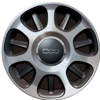
7 küllős gyémántfényű