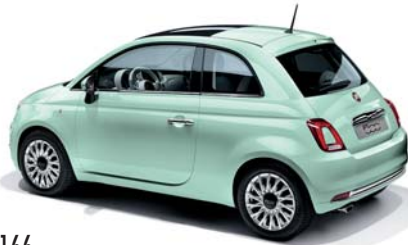
166 LATTEMENTA ZÖLD