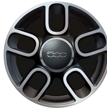
5 küllős bikolor sportos kivitel