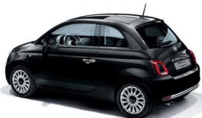
876 VESUVIO FEKETE