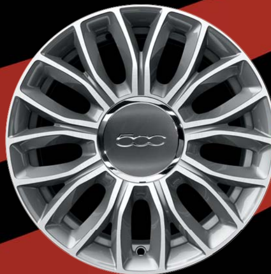
5YN - 15"-OS SZÜRKE GYÉMÁNTFÉNYŰ könnyűfém keréktárcsák