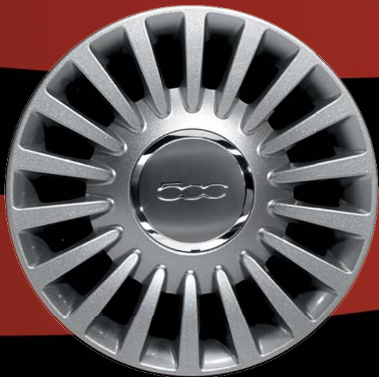
431 - 15"-OS FÉNYES EZÜST könnyűfém keréktárcsák