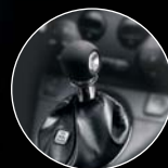
VÁLTÓGOMB ELEFÁNTCSONTSZÍN BŐR (opció)