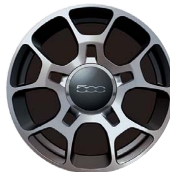
5 küllős gyémántfényű sportos kivitel