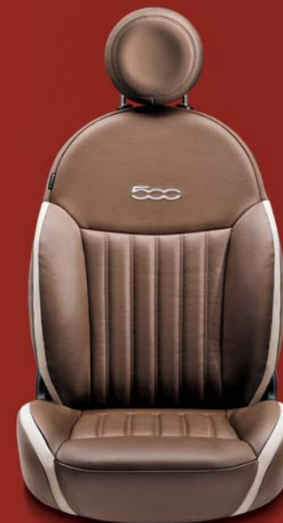
POP - LOUNGE (OPCIÓ) 461

Burgundy Frau bőrkárpit elefántcsontszín betétekkel. Burgundy bőr fejtámla kontrasztos, hímzett kék 500-as logóval.