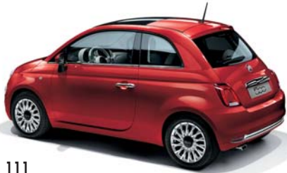
111 PASSIONE PIROS