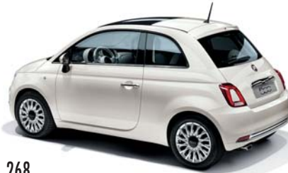
268 GELATO FEHÉR