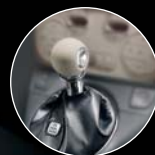
VÁLTÓGOMB ELEFÁNTCSONTSZÍN BŐR (opció)