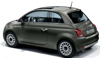
372 COLOSSEO SZÜRKE