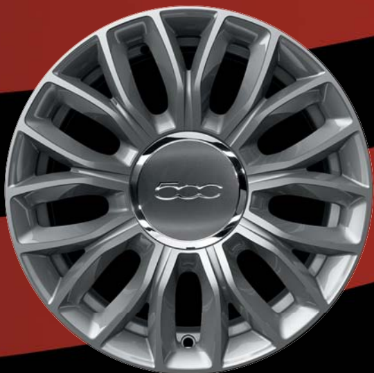
73Z - 15"-OS FÉNYES EZÜST könnyűfém keréktárcsák