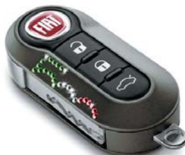
Swarovski - 500-as minta