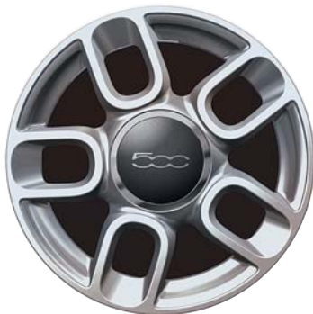
5 küllős bikolor sportos kivitel