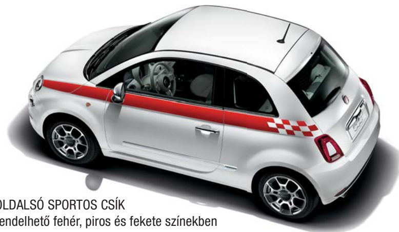
OLDALSÓ SPORTOS CSÍK rendelhető fehér, piros és fekete színekben