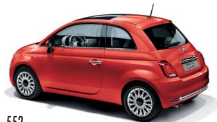
552 KORALL PIROS