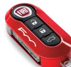
Korallszín és chevron mintás készlet