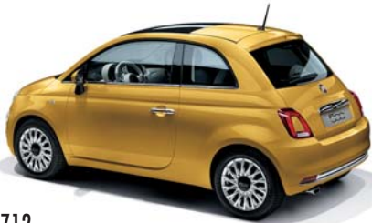
712 SOLE SÁRGA