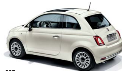
227 GHIACCIO FEHÉR