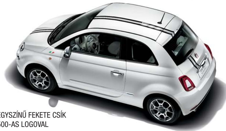
EGYSZÍNŰ FEKETE CSÍK 500-AS LOGOVAL