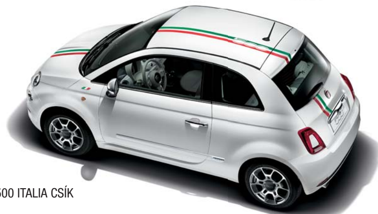
500 ITALIA CSÍK