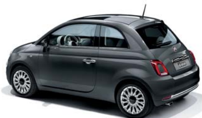
695 POMPEI SZÜRKE