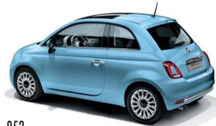
952 VOLARE KÉK