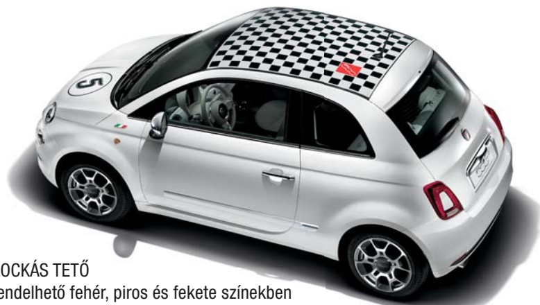
KOCKÁS TETŐ rendelhető fehér, piros és fekete színekben

Matricák, kulcsborítások, logók, sminktartók, iPod-tartók, keréktárcsák: akik kreativitásukat szeretnék kifejezni mindent megtalálnak ahhoz, hogy saját ízlésük szerint tovább alakítsák ezt a valódi design tárgyat és igazi egyedi darabot hozzanak létre.