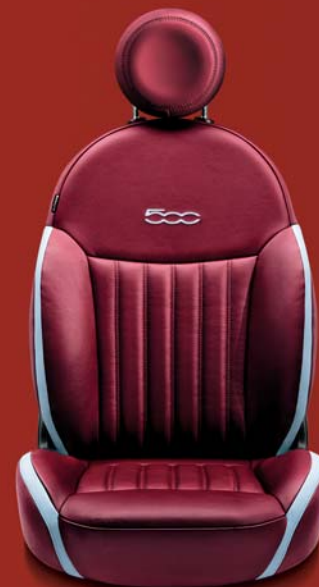
POP - LOUNGE (OPCIÓ) 688

Burgundy Frau bőrkárpit elefántcsontszín betétekkel. Burgundy bőr fejtámla kontrasztos, hímzett elefántcsontszín 500-as logóval.