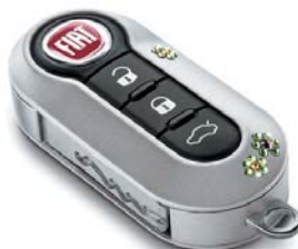
Swarovski - Virág minta