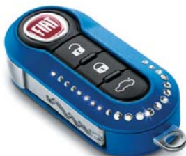
Swarovski - Kígyó minta