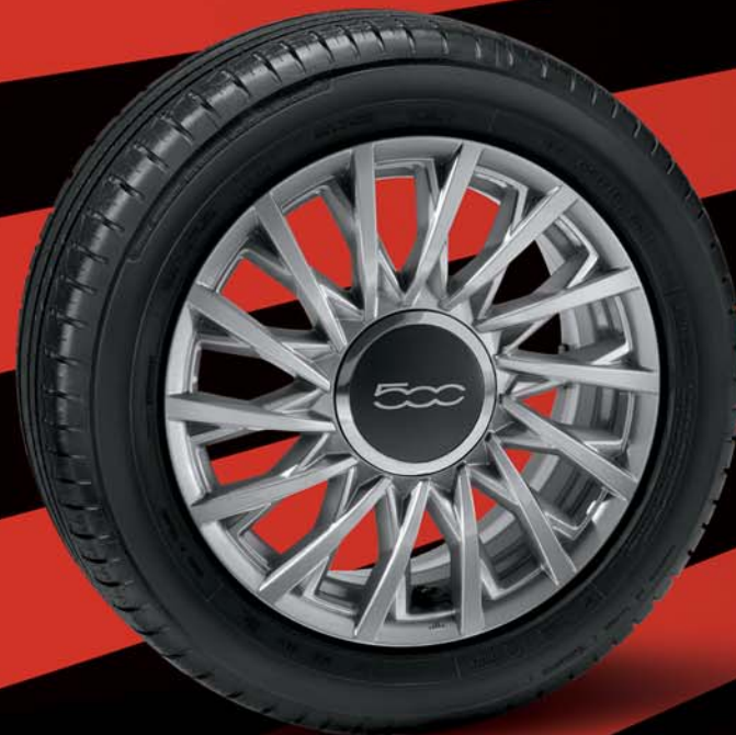
74B - 15"-OS FÉNYES EZÜST könnyűfém keréktárcsák