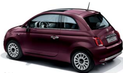
866 BURGUNDY OPERA LILA