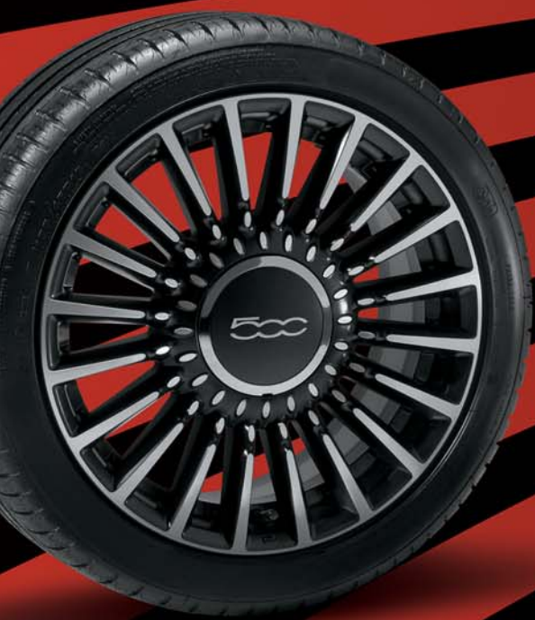
5ZZ - 16"-OS MATT FEKETE GYÉMÁNTFÉNYŰ könnyűfém keréktárcsák