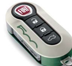
zöld-fehér Military készlet