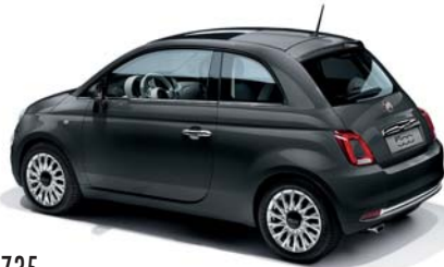
735 CARRARA SZÜRKE