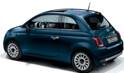
687 DIPINTO DI BLU KÉK