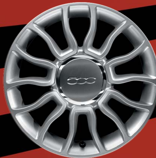
4WQ - 15"-OS FÉNYES EZÜST könnyűfém keréktárcsák